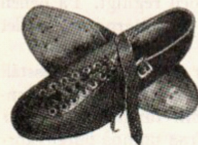
OL-skor spik versus promenad med ribbor

GISLAVED Svenska Gummitfabriks Aktieföretag - Gislaved