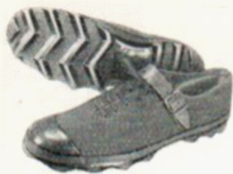
Orienteringsskor av gummi med ribbad undersida.