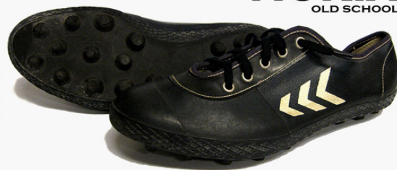
NOKIA OLD SCHOOL